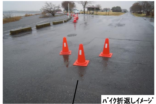
バイク折返しイメージ

Bタイプ 第一ラン(1R) 3km(3km×1周) バイク(B) 50km (10km× 5周) 第二ラン(2R) 10km (2km× 5周)