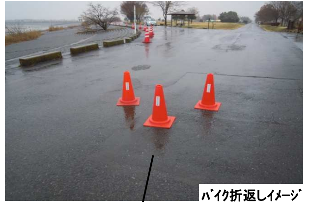
バイク折返しイメージ

Bタイプ 第一ラン(1R) 3km(3km×1周) バイク(B) 50km (10km× 5周) 第二ラン(2R) 10km (2km× 5周)